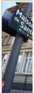
La maison de santé encore accueillie